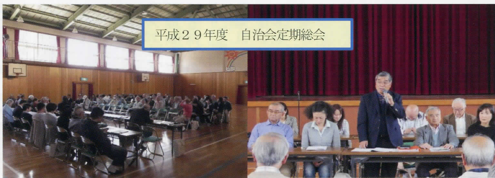
平成29年度 自治会定期総会

盛会のうちに終了しました。次の方々が総会で承認を頂き、役員に就任いたしました。よろしくお願ひいたします。