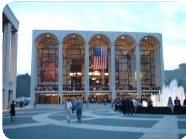
メトロポリタン歌劇場

ご興味のある方は、どうぞ左記までご連絡下さい。上映の数日前に簡単な解説書をお配りしております。