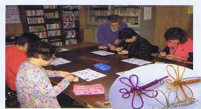
会長さんの可愛いトンボのブローチ作り