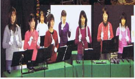
トーンチャイム演奏