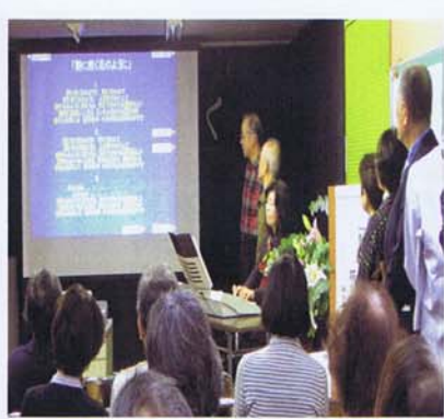
コーラス (神和台エコー)