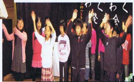
コーラス (名谷小6年生)