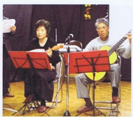
マンドリン・ギター合奏