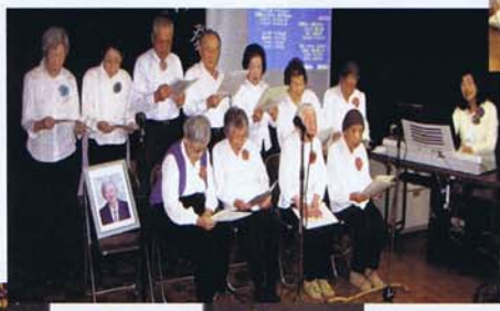
コーラス (有悠クラブ笑生会)