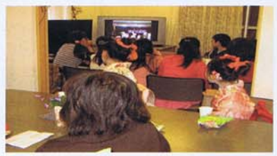
1Fサロンでくつろぎながらテレビで観賞