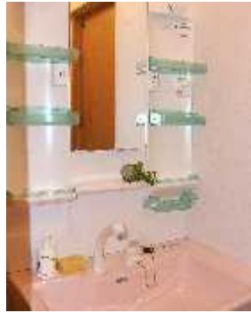
女子トイレの洗面台

さ張らず、色、そして新しいものをと、ちよつとくだわりを持って、条件に合った椅子を揃えました。