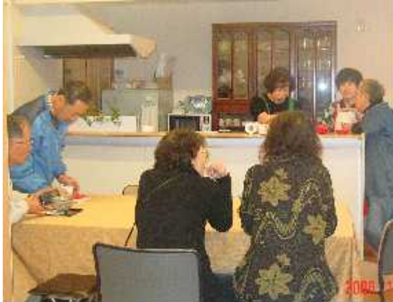
サロン室 文化祭の日喫茶サロンで歓談

放たれた窓から差し込む陽で暖かく、こんなに明るい部屋であったことに改めて感動いたしました。この部屋に誰もたし集まり、語り合つて部屋中に笑い声が響いて