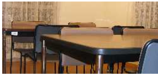
奥和室跡の小会議室 サロン室ともつながる

放たれた窓から差し込む陽で暖かく、こんなに明るい部屋であったことに改めて感動いたしました。この部屋に誰もたし集まり、語り合つて部屋中に笑い声が響いて