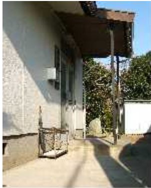
飾り石を奥に移動して平坦になった玄関アプローチ

運び、色、大きさとも想像していた通りの机がリサイクルショップで運良く見つかり調達することが出来ました。椅子は座り心地が良く、軽くてか