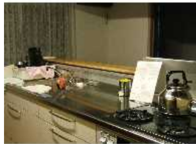
オープンキッチンですがロールカーテンで仕切れる

運び、色、大きさとも想像していた通りの机がリサイクルショップで運良く見つかり調達することが出来ました。椅子は座り心地が良く、軽くてか