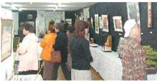
作品展に多数が来場

た人、当日の事を思い描き、素晴らしい文化祭を思い描き、それぞれにやることの喜びを感じながら働いている様子に、本当に思いやりのあるこの暖かい人達の住む地域に住めたことに幸せを感じました。職場でも、神和台の活動のこと(夏祭り・清掃・見回り・ネット・文化祭等)を話題に出すと、「すごい活発ね」「うち活動してない」「もともとないのよ」とか、神和台のような自治会が普通だと思