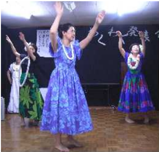
トリはフラダンスで盛り上がった