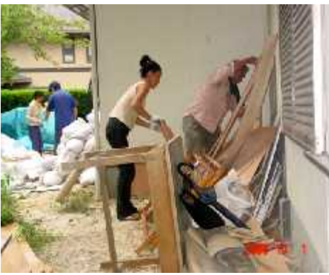
廃材もボランティアで片付け荒ごみで処理しました